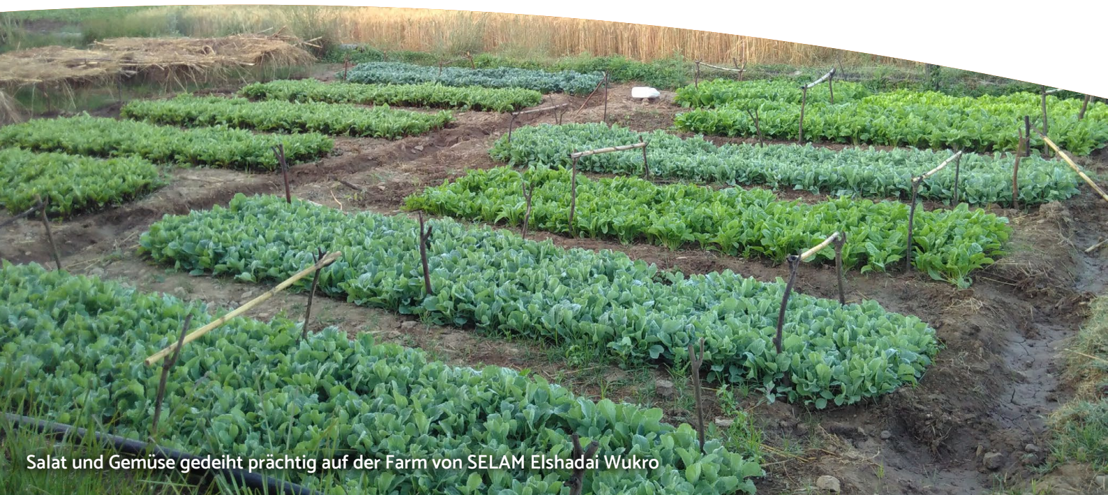
Salat und Gemüse gedeiht prächtig auf der Farm von SELAM Elshadai Wukro

Farm SELAM Elshadai Wukro: Mit 11 ha Agrarland gibt es einiges zu bewirtschaften auf der Farm von SELAM Elshadai Wukro. Der Wert der Farm hat sich gerade in dieser Krisenzeit mehr denn je gezeigt. Die Produkte der Farm haben dazu beigetragen, das Leben der Kinder in einer Zeit zu erhalten, in der die Märkte völlig abgeschnitten waren. Die Farm konnte nicht nur die Kinder, sondern auch die Mitarbeitenden und die Leute aus der Umgebung versorgen. Die Leitung bangte besonders um die Sicherheit der Milchviehherde. Gott sei Dank blieb die Farm