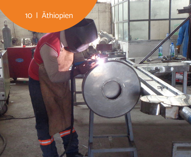
In den Werkstätten wird fleissig geschweisst.