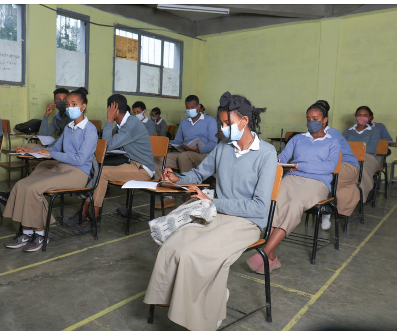
Auch in der Schule werden die Corona Massnahmen befolgt.

Schule SELAM Elshadai Wukro / Wukro: Im Kinderdorf SELAM Elshadai Wukro besteht ein schulisches Angebot für die Wukrokinder sowie externe Schulkinder vom Kindergarten bis zur 8. Klasse. Aufgrund der bekannten Umstände war der Unterricht nicht immer gewährleistet. Die Leitung des Kinderdorfs bemühte sich nach Kräften, die Schule offen zu halten, auch wenn die Eltern der externen Schulkinder das Schulgeld kaum mehr zu bezahlen vermochten.