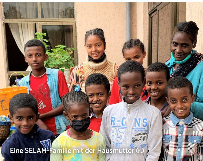
Eine SELAM-Familie mit der Hausmutter (r.)

Neben der Pandemie hat auch der Krieg im Norden Äthiopiens das Jahr geprägt. Obwohl alle Mitarbeitenden und älteren Kinder geimpft werden konnten, musste der Hinschied einer sehr geschätzten Hausmutter beklagt werden; sie starb vermutlich an den Folgen einer Covid-19-Infektion. Trotzdem fanden viele Aktivitäten für die Kinder statt, wie z.B. eine Kunstausstellung mit Handarbeitsprojekten der SELAM-Kinder, ein Literaturevent, Ausflüge u.a.m. Zweimal erhielt das Kinderdorf auch grosszügige Bücherspenden. Dorfleiter, Sozialarbeitende und Hausmütter wurden von lokalen Psychologen zum Thema Traumabewältigung geschult und eine Heilpädagogin konnte angestellt werden. Insgesamt wohnten per 31.12.2021 182 Kinder im Familienmodell auf den beiden SELAM-Geländen in Addis Abeba. Sechs Kinder wurden neu aufgenommen, und fünf Kinder konnten mit ihren Eltern zusammengeführt werden.