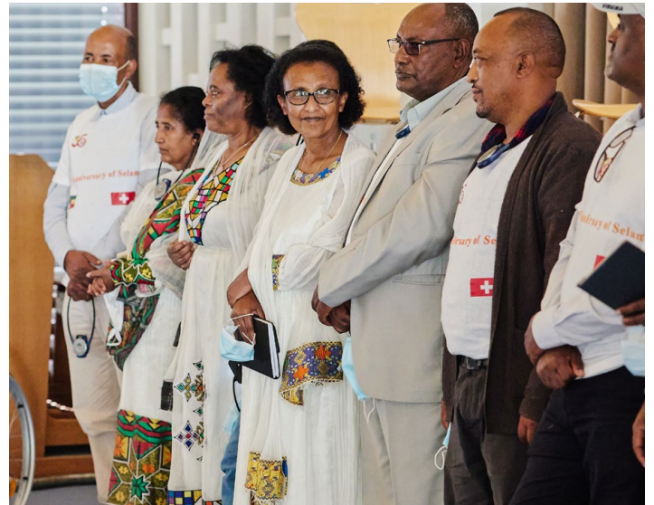
Die äthiopische Delegation am SELAM Jubiläum