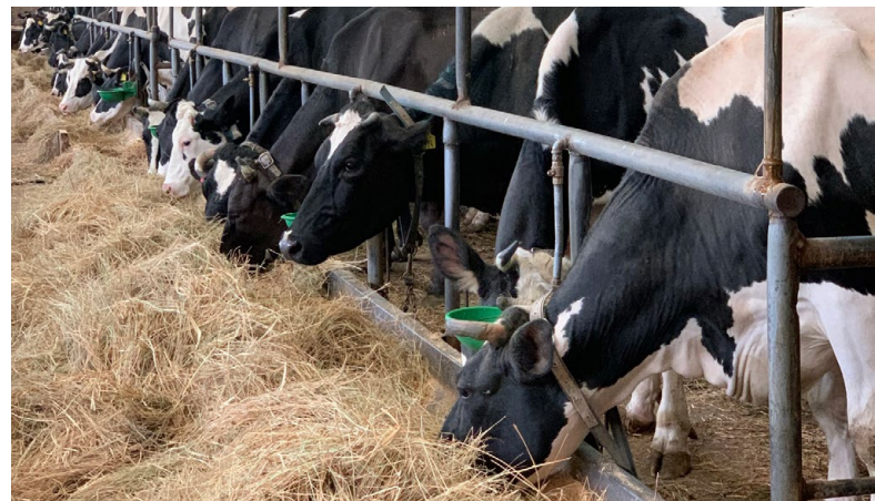
Die Kühe im SELAM Stall

Landwirtschaft SELAM Children's Village: Mit verschiedenen Investitionen, z.B. für neue Ställe für Milchkühe und Legehennen und die Installation einer Tropfbewässerung, hat sich die SELAM-Landwirtschaft auf den Wechsel vom Ausbildungszentrum unter das Dach der Firma ROFAM vorbereitet, der schliesslich im Januar 2022 vollzogen werden konnte. Die neue Dynamik, die dieser Schritt auslöst, ist in der Tierhaltung schon gut spür- und sichtbar.