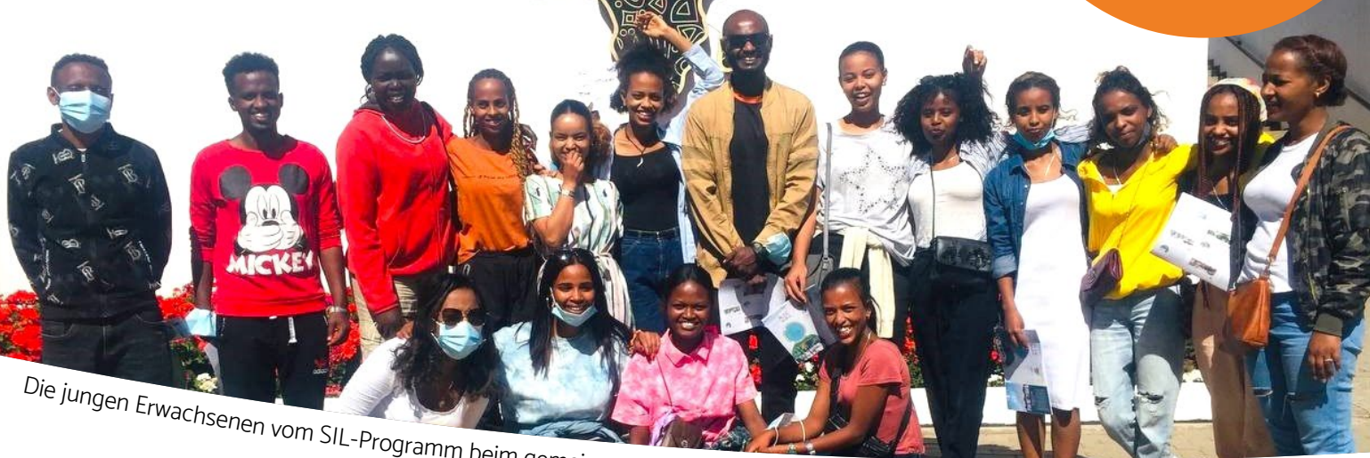
Die jungen Erwachsenen vom SIL-Programm beim gemeinsamen Ausflug