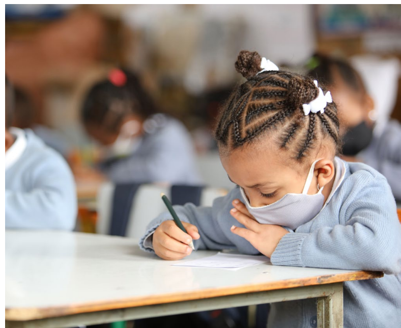
Ein Kindergartenkind vertieft beim Schreiben lernen.