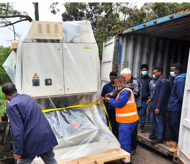
Der Container mit der CNC-Maschine wird ausgepackt.