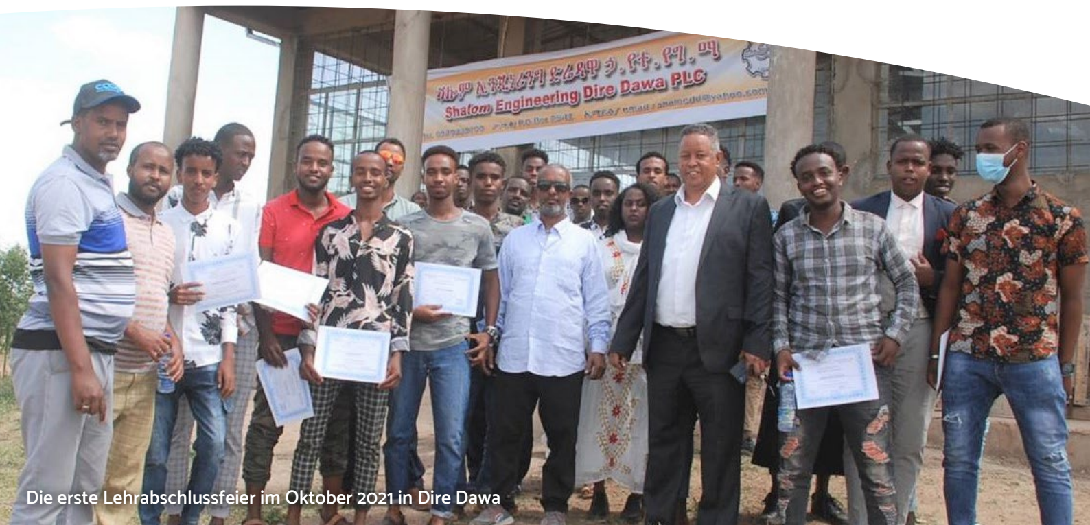
Die erste Lehrabschlussfeier im Oktober 2021 in Dire Dawa

2019 wurden die ersten Lernenden für einen regulären Metallbaulehrgang aufgenommen. 2021 konnte der erste Kurs für Kurzeitler begonnen werden, der mit einer «Graduation»-Feier im Oktober abgeschlossen wurde. Das Verhältnis mit der lokalen Somali-Gemeinschaft ist gut und unter den neuen Lernenden sind nun auch junge Männer aus dieser Gemeinschaft dabei. Mit einem Beitrag von SELAM Schweiz konnten Hochwasser-Schutzmauern gebaut und bauliche Mängel an den Werkhallen behoben werden. Grossen Bedarf gibt es in Bezug auf das Marketing, um die Shalom-Produkte und die Ausbildung in Dire Dawa bekannter zu machen. Per 31.12.2021 waren 19 Personen beschäftigt, 2 Frauen und 17 Männer.